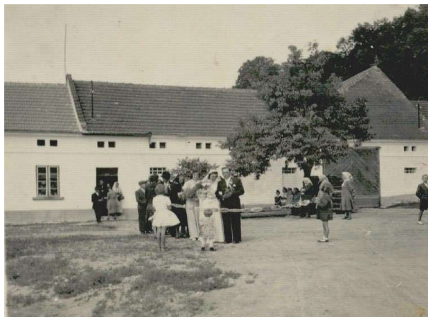
svatba, v pozadí dům č. 27

Kdo to byli Dvořáci – jsou uváděni v 16. stol. jako zvláštní privilegovaná třída. Byli to velcí sedláci s rozsáhlými dvory, s četnými polnostmi. Jejich dvory byly nadány různými výsadami. Byla to třída vážená a zámožná. Říkalo se jim též „svobodníci“ či „nápravníci“. Z této doby je uváděn svobodný dvůr v Jabloňanech č.19. Z těchto pradávných „dvořáků“ vzešlo potomstvo dnešního příjmení Dvořák.