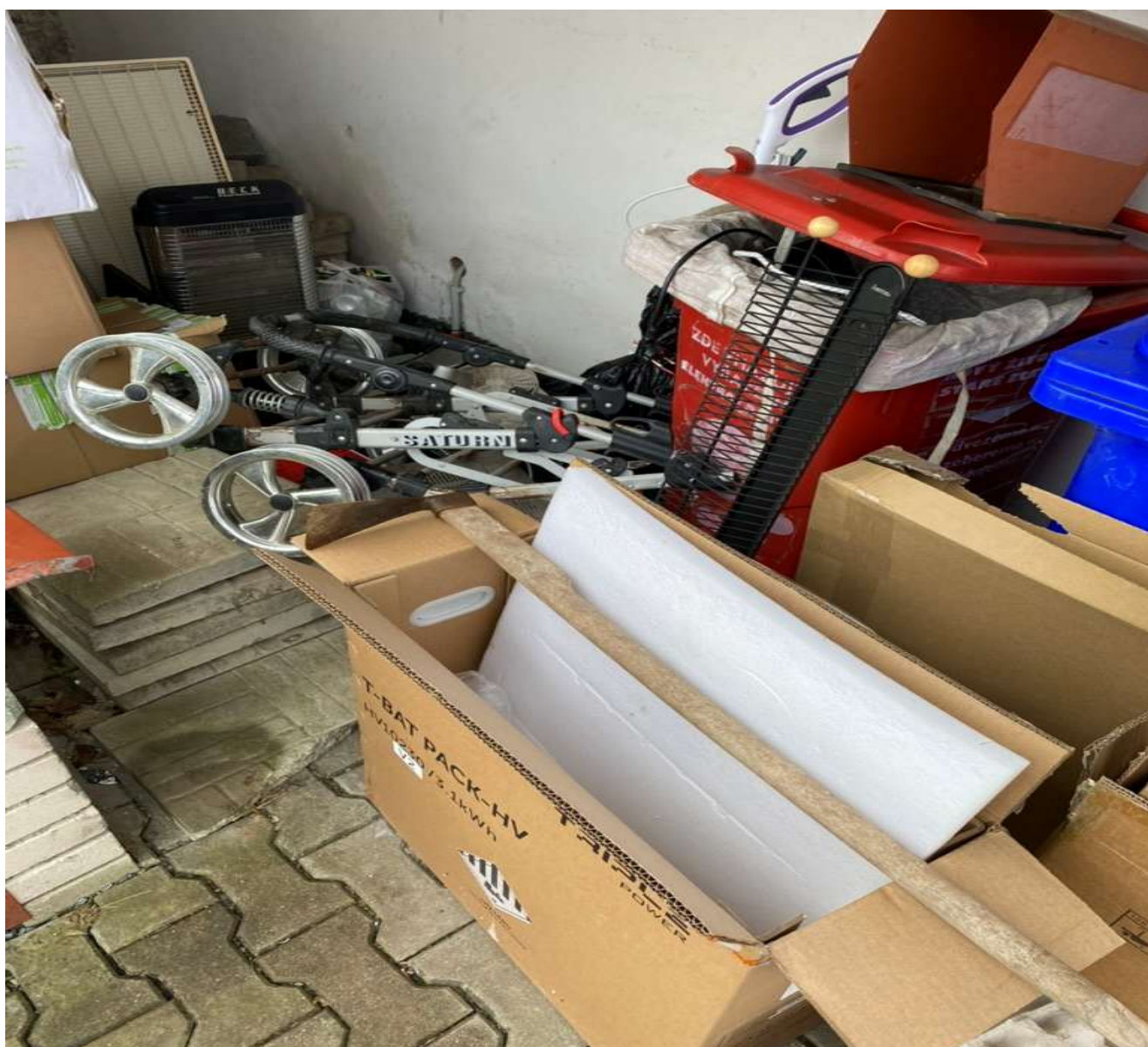
Místo pro tříděný odpad u obecního úřadu zaskládané nevytříděným odpadem