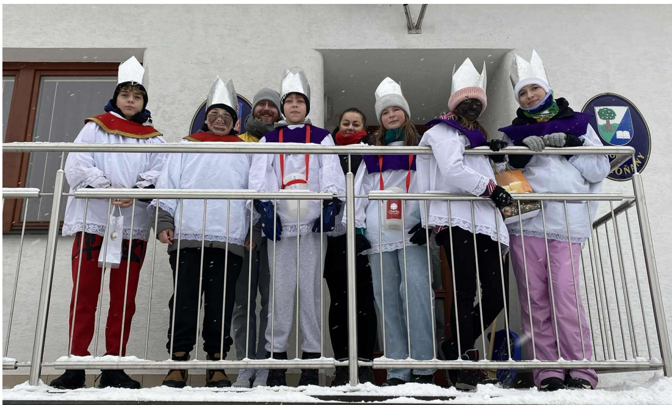
Účastníci tříkrálové sbírky