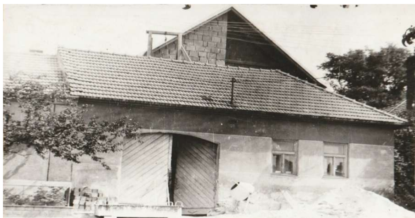
Již neexistující část domu č. 13, nyní se zde nachází dům č. 120, v pozadí je vidět započatá stavba tohoto domu.

Červenec tohoto roku je pro nás měsícem dvou těžkých živelných pohrom. 4. července o půl deváté večer přihnala se od západu hrozná smršť větrná, doprovázená velikou bouří. Rychlost větru byla úžasná, vzduch byl pln písku, prachu a drobných kamínků. Škody na stromoví veliké. Mnohé střechy poškozeny. 25. července po čtvrté hodině odpolední přihnala se bouře s ničivým krupobitím. Obilí vytlučeno, zejména těžce poškozeny ječmeny, nejvíce poškozena úroda směrem ke Krhovu a Oboře. Více než poloviny ovoce leží na zemi... „