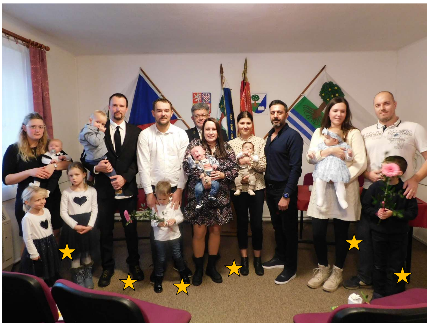
Vítání nových občánek