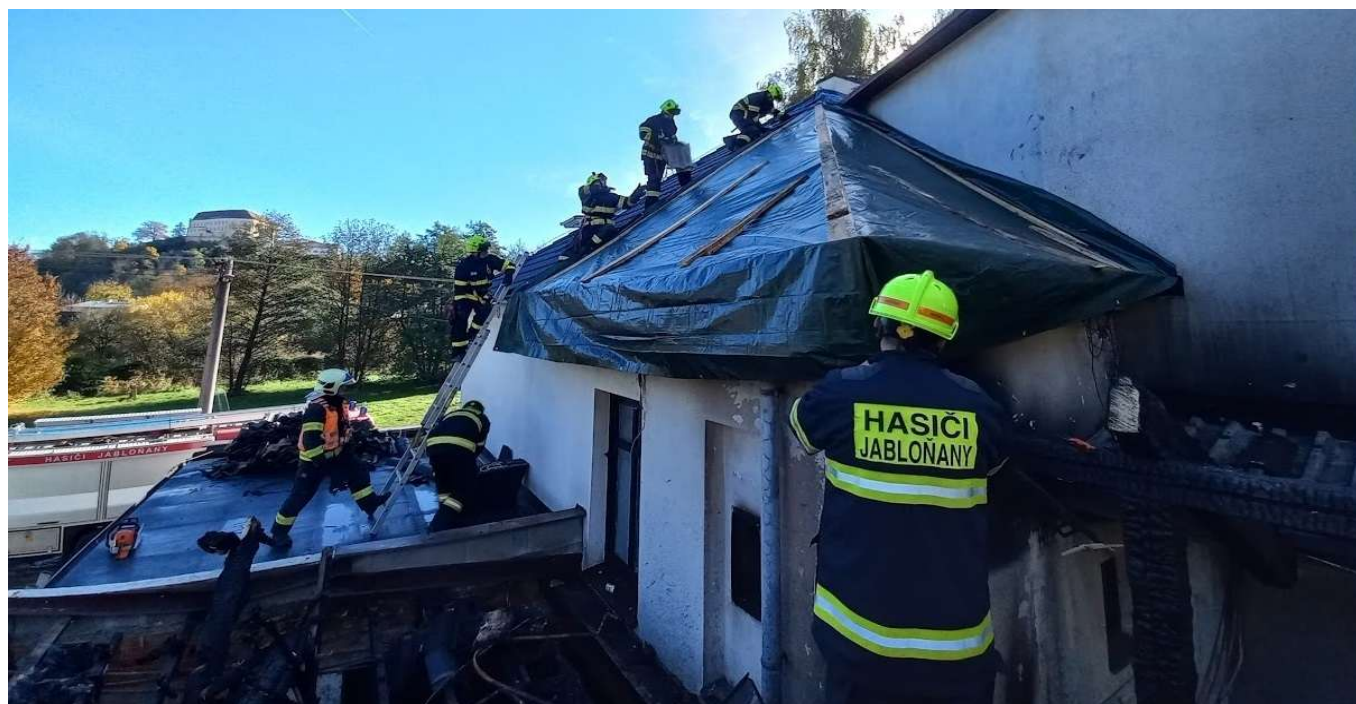
Foto: zásah JSDH Jabloňany v Letovicích, zabezpečení střech rodinného domu po požáru

Po dvanácté hodině jsme se vrátili do Jabloňan. Zakrývací plachty, kterými jsme požárem poškozenou střechu rodinného domu zabezpečili proti nepříznivým povětrnostním vlivům, nám následně uhradilo město Letovice prostřednictvím místní JSDH. Finanční náklady na náš zásah (pohonné hmoty) související s předurčeností ochrana obyvatelstva budou následně uhrazeny z dotací na zásah mimo katastr obce zřizovatele.