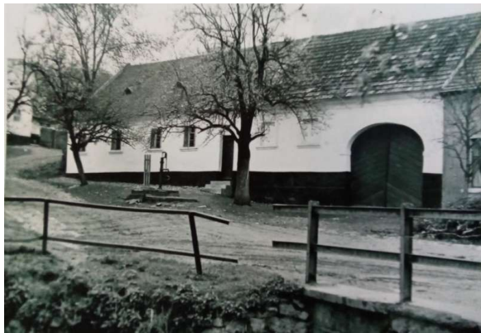
Foto zaniklého gruntu č.29 „u Perotů“, nyní postaven dům č.p. 136