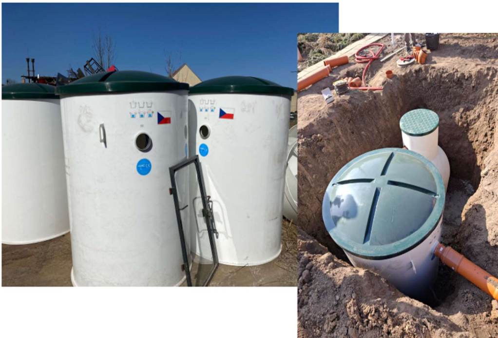
Nové čistírny odpadních vod