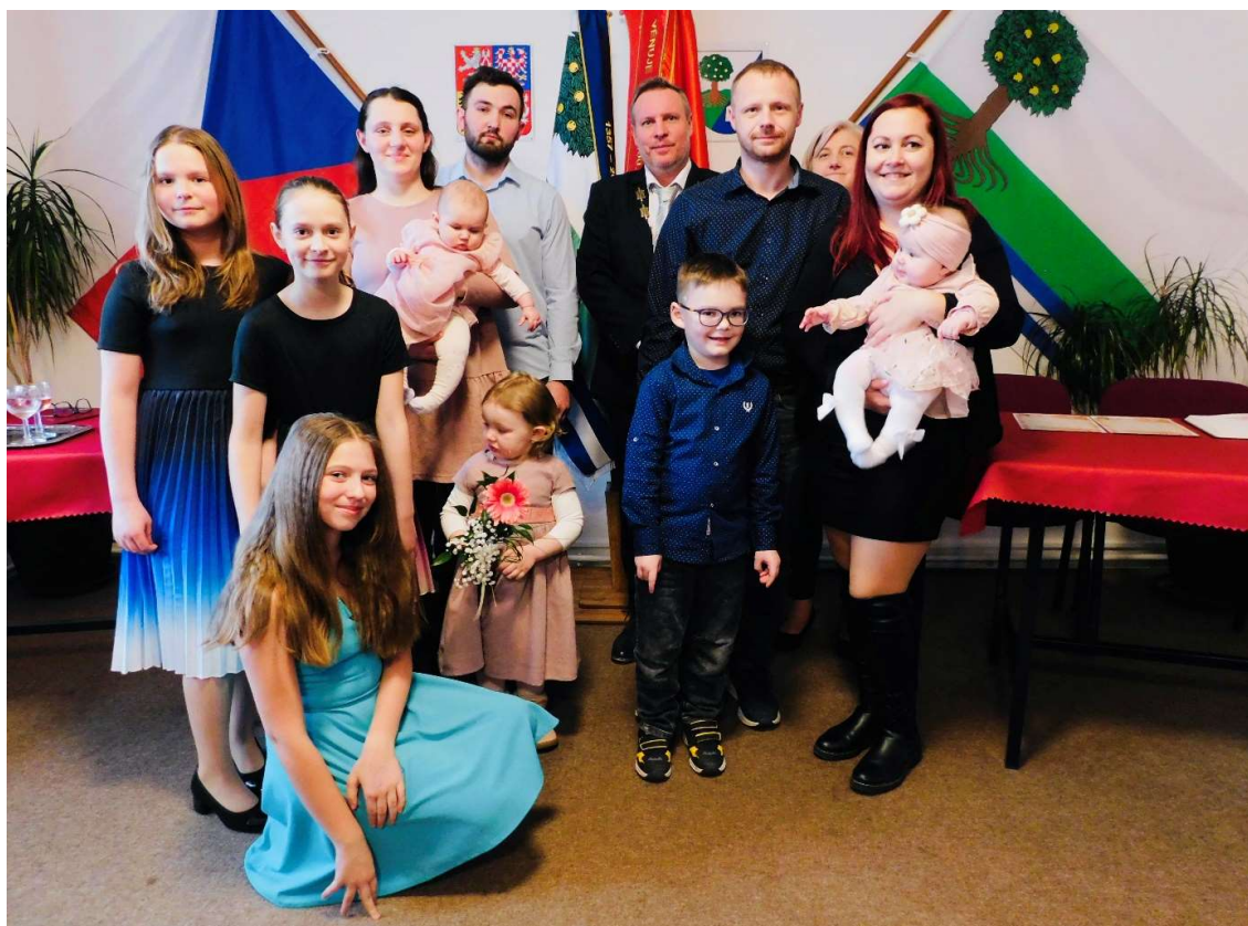
Vítání nových občanů