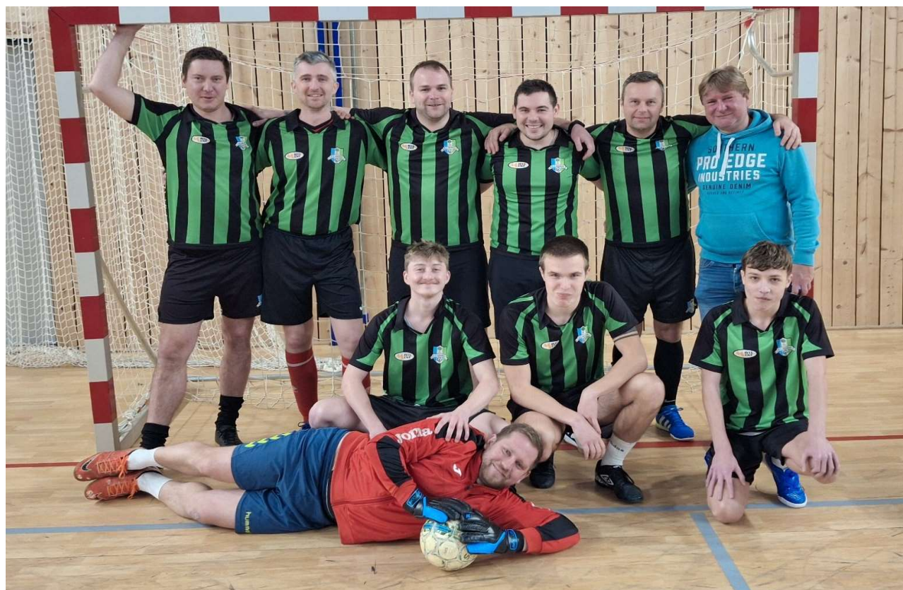
Turnaj ve Svitávce

Rok 2025 jsme zahájili turnajem 15. února v hale ve Svitávce. Za účasti osmi mužstev jsme nakonec obsadili šesté místo a bohužel jsme nenavázali na umístění z minulého roku, kdy jsme celý turnaj vyhráli.